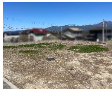
C区画 南西からの眺望