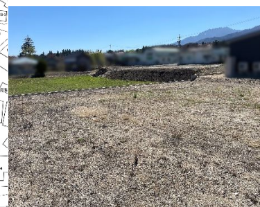
F区画 北東からの眺望